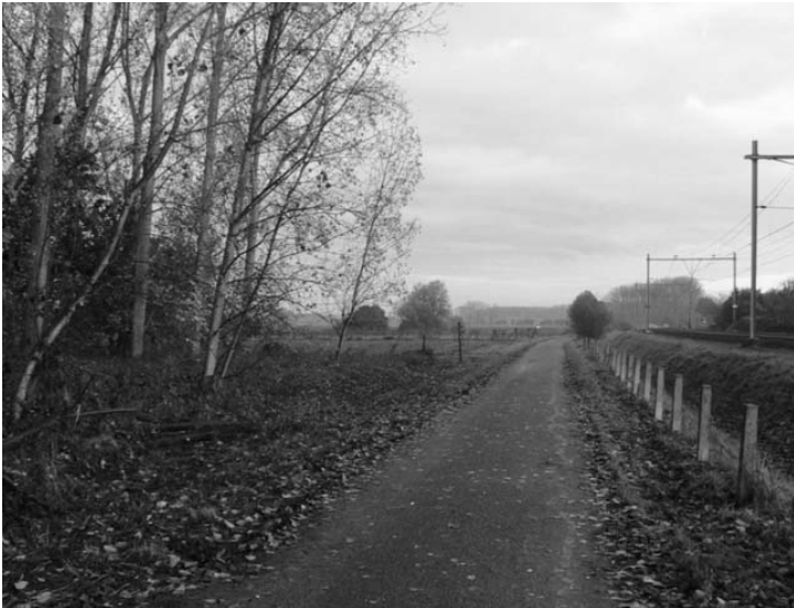
De Kampweg zoals het nu is.....

Tot slot: wij zouden transport over water willen aanmoedigen aangezien schepen weinig lawaai en geen trillingen veroorzaken, een enorme capaciteit hebben en er dan nauwelijks tot geen natuur hoeft te wijken voor asfalt of spoor.