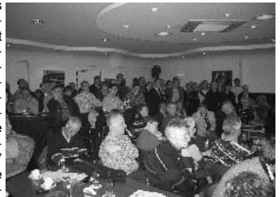
Een volle zaal tijdens de info-avond

strijd voor een leefbaar Nieuwstadt. Politieke 'tegenstanders' hebben vooraf gepoogd om onze goede bedoelingen te bagatelliseren. Maar dat is hun niet gelukt. En dat wilden we ook graag zo houden! Uw steun is daarbij onontbeerlijk! Wij zullen ons in de toekomst met name gaan richten op het tegenhouden van de railverbinding tussen de yard en de bestaande spoorlijn Sittard-Roermond. Maar ook andere zaken, zoals bijvoorbeeld de sluiting van de spoorwegovergang Neerveldsweg, de geluidshinder van de nieuwe spoorbrug over de N297 en de lichtvervuiling die de yard straks te weeg gaat brengen, zullen wij niet uit het oog verliezen. Hoe het ook zij, U zult in de toekomst nog heel wat gehuil van Stichting De Groene Sporenwolf gaan horen. En U mag gezellig meehuilan, graag zelfs!!!