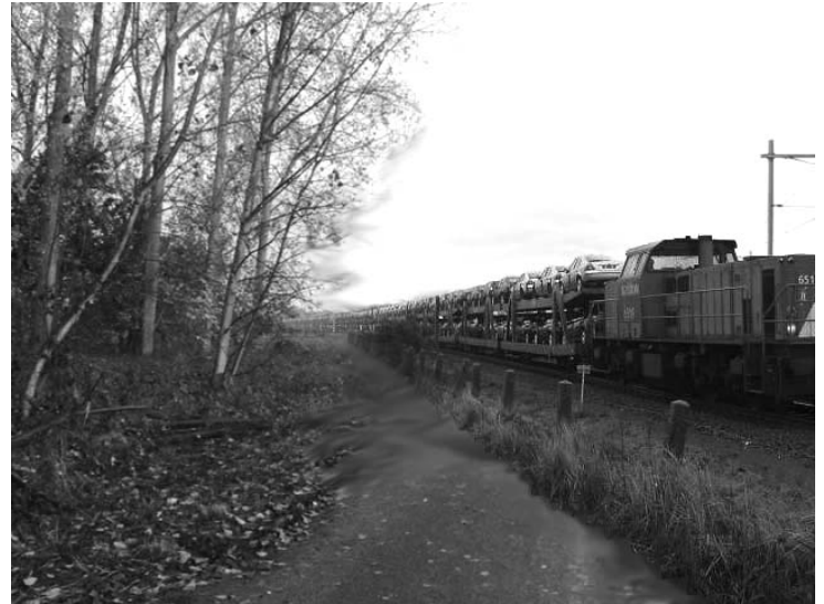
en..... is dit het toekomstbeeld dat we willen?