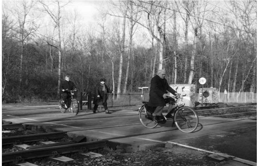
overweg Neerveldsweg: binnenkort verleden tijd?

Wilt u hulp bij het schrijven van een bezwaarschrift tegen de sluiting van de spoorwegovergang in 'Het Hout' zoek dan contact met de hieronder genoemde bestuursleden van De Groene Sporenwolf. Zij helpen U graag.