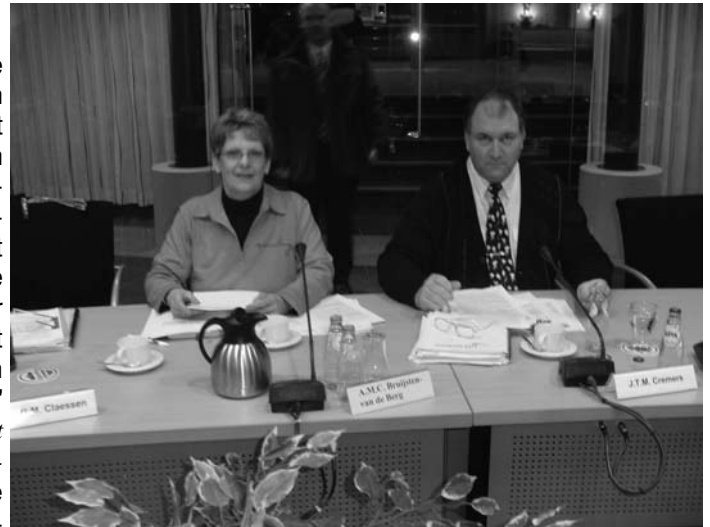
DES (foto), D66 en Groen Links verdienen een pluim!

Tijdens de laatste gemeenteraadsvergadering van 2004 diende de fractie GroenLinks een initiatiefvoorstel in. De bedoeling van dit voorstel was eigenlijk heel eenvoudig: de fractie wilde in het geldende bestemmingsplan voor Nieuwstadt en omgeving laten vastleggen dat de aanleg van nieuwe spoorwegverbindingen binnen dat plan niet langer zijn toegestaan. Een logisch vervolg eigenlijk op het eerder aangenomen GroenLinks-amendement met betrekking tot de grenscorrectie. Het initiatiefvoorstel haalde de eindstreep niet. Met name het CDA liet zich op 23 december 2004 weer eens van zijn beste zijde zien. Raadslid van Helvert stelde dat het CDA nu nog geen standpunt over de yardspoorlijn wilde innemen. Vreemd genoeg zei van Helvert in 'De Limburger' van 29 juli 2002: "Oppositiepartij CDA is faliekant tegen de komst van een aparte spoorlijn, vooral omdat hierdoor weer een stuk natuurlandschap dreigt te verdwijnen". (opgemerkt moet worden dat in de voormalige gemeente Susteren de fractie CDA een oppositiepartij was; sinds de fusie met Echt zijn CDA, Algemeen Belang en Samenwerking coalitiegenoten en vormen samen de regerende meerderheid). Alleen GroenLinks, Democraten Echt-Susteren en D'66 hadden het belang van het voorstel wél in de gaten en stemden voor. Een raadsmeerderheid heeft dus een unieke kans laten liggen om de aanleg van de yardspoorlijn minimaal te bemoeilijken en dat is een zeer trieste constatering, vooral voor de inwoners van Nieuwstadt.