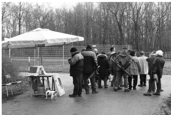
Tekenen van bezwaarschriften tijdens informatieve wandeling.

Wat heeft de hernieuwde behandeling van dit punt in de raad nu concreet opgeleverd? Alvast iets: er is een omslag gaande in het denken. Duidelijk is dat een raadsmeerderheid opeens interesse heeft getoond voor de problematiek en zich is gaan verdiepen in de kwestie. Verder lijkt het alsof een meerderheid vindt dat de bevolking van Nieuwstadt op de een of andere manier via de Neerveldsweg aan de andere kant van het spoor moet kunnen komen, zonder te hoeven omrijden via de kern Susteren. Dat hebben we als Stichting De Groene Sporenwolf toch alvast bereikt maar we zijn er nog lang niet!!!!