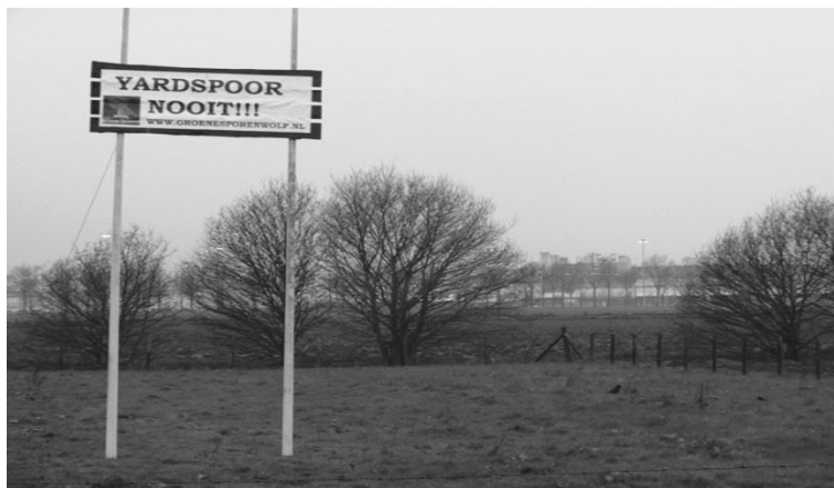
Duidelijke taal: "YARDSPOOR NOOIT"

De plannenmakers willen toch het te betreuren goederenspoor tussen de nog te ontwikkelen yard en de spoorlijn Sittard-Roermond gaan aanleggen. Men gaat hierbij voortvarend te werk. Althans, men hoopt in de nabije toekomst voortvarend te werk te kunnen gaan maar dat zou in de praktijk nog wel eens vies tegen kunnen gaan vallen. Als ze denken dat De Groene Sporenwolf terug is in zijn hok maken ze een ernstige denkfout. Door het geweldige succes van de bezwaarschriftenactie rond de spoorwegovergang 'Neerveldsweg' is het beestje waakzamer en scherper dan ooit. Voordat men kan gaan beginnen aan de concrete uitwerking van de omstreden en ingrijpende plannen rondom de yard, is men wettelijk verplicht om de inwoners van Nieuwstadt en andere belangstellenden en belanghebbenden eerst te informeren over de snode plannen. Hiertoe heeft men een openbare informatiebijeenkomst gepland die zal gaan plaatsvinden op woensdag 20 april 2005 om 20.00 uur in het Gemeenschapshuis aan de Millemerstraat in Nieuwstadt . De avond wordt georganiseerd door de Provincie Limburg, het LIOF, de gemeente Echt-Susteren en de gemeente Sittard-Geleen.