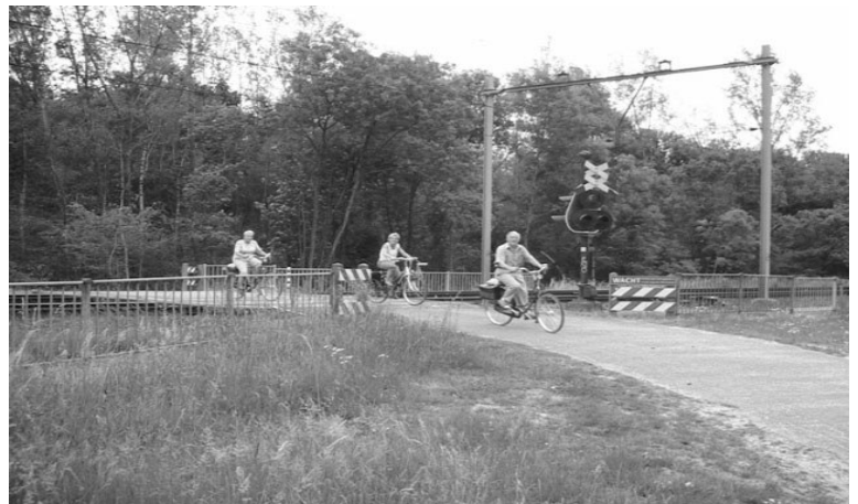
Fietsers passeren overweg Neerveldsweg, pure recreatie toch!!!

De raad zal ondertussen beïnvloed worden door het plan om een tunneltje onder het spoor aan te leggen, op de locatie waar ook de Vloedgraaf het spoor passeert. Tijdens het vragenuurtje voorafgaand aan de raadsvergadering van 12 mei jl. kwam deze optie al naar voren. Stichting De Groene Sporenwolf heeft toen heel goed opgelet en wij komen tot de conclusie dat het gepresenteerde voorstel totaal geen gelijkwaardig alternatief is voor de sluiting van de overweg. Oordeel zelf: het tunneltje mag alleen gepasseerd worden als voetganger, het tunneltje is pas klaar in 2011, en wie het onderhoud gaat betalen is nog een punt van discussie. Acht men de inwoners van Nieuwstadt zó dom? Wij vinden dit pure minachting van de burger! Lees het vervolg op pagina 2.