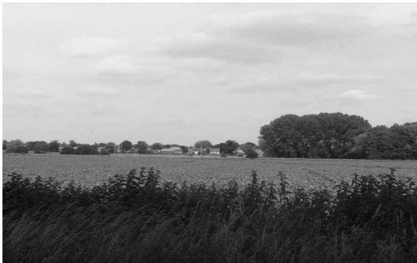
De groene buffer tussen NedCar en Nieuwstadt.

Voorstanders van het yardspoor leggen de nadruk op compensatie middels geluidschermen en de aanleg van nieuwe natuur middels Landschapspark Susteren. Tevens spelen ze in op het sentiment van de burger door te suggereren dat zonder yardspoor het voortbestaan van NedCar op het spel staat. Tegenstanders als De Groene Sporenwolf willen absoluut géén goederenspoorlijn zodat er niet nog meer trillingen en geluid zal zijn. Ook is misschien de yard zélf wel van tafel als het spoorlijntje er niet komt, aangezien Broekman een spoor aansluiting eist indien zij de yard gaan exploiteren. Hierdoor blijft er een groene buffer bestaan tussen NedCar en Nieuwstadt, voorkomen we lichtoverlast van de yard en kan de schutterij blijven zitten waar ze zit.