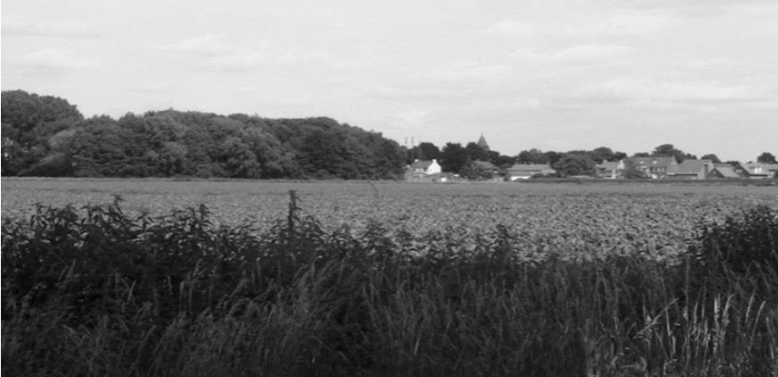
Wordt dit vervangen door spoor, beton en 12.000 auto's???

Ja, maar technisch gezien is dit haast onmogelijk. U moet zich voorstellen dat, net zoals in Susteren, naast de tunnel aan weerszijden een parallelweg moet worden aangelegd voor de bewoners van de Limbrichterstraat. Zij moeten hun huis kunnen bereiken. Gezien de breedte van de Limbrichterstraat is dit niet mogelijk, zelfs niet als de voortuinen van de huizen worden meegenomen.