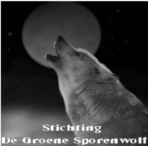
Stichting De Groene Sporenwolf